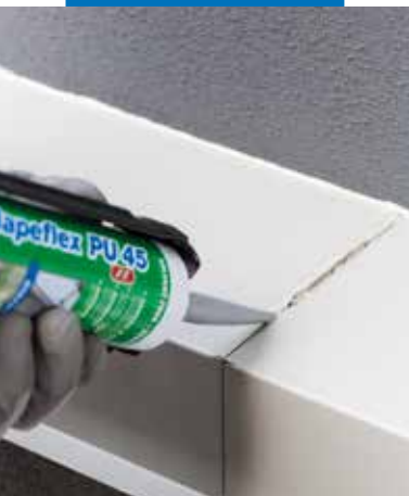
Sellado elástico de juntas de construcción

del aire y, gracias a sus características, ofrece elevadas garantías de durabilidad, pudiéndose emplear tanto sobre superficies horizontales como verticales.