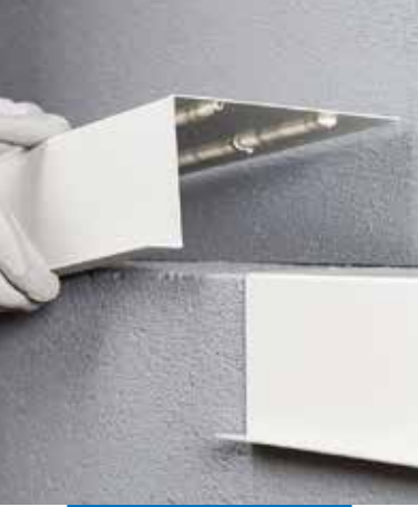
Encolado elástico de elementos constructivos